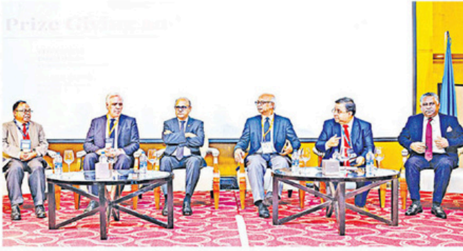
পুরস্কার বিতরণী ও সমাপনী অনুষ্ঠানে অতিথিরা।