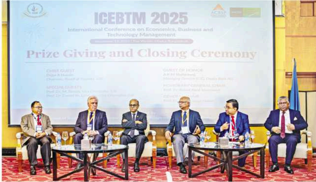
The prize giving and closing ceremony of the two-day International Conference on Economics, Business and Technology Management 2025 (ICEBTM 2025), organised by the School of Business and Entrepreneurship (SBE) of Independent University, Bangladesh (IUB), at a city hotel on Saturday. — Press Release